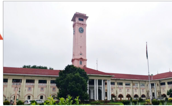
सिके अनिल को बिहार राज्य योजना परिषद की जिम्मेदारी