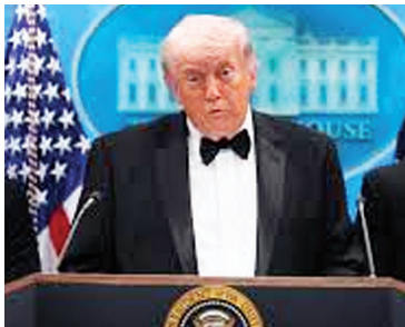
सभी लोग सुरक्षित हैं। शरीरों ने कहा कि उनकी संवेदनाएं और प्रार्थनाएं इस घटना से प्रभावित सभी लोगों के साथ हैं। उन्होंने ट्रंप के लिए लगातार सुरक्षा और अच्छे स्वास्थ्य की कामना भी की।

जिसने उन्हें गहरा झकझोर दिया है। उन्होंने बताया कि यह जानकर राहत मिली कि डोनाल्ड ट्रंप, उनकी पत्नी और कार्यक्रम में मौजूद अन्य