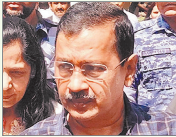
राज्यसभा के सभापति को पत्र लिखूंगा और मांग करूंगा कि इन सांसदों को अयोग्य ठहराया जाए।