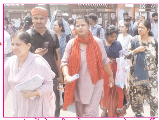
झारखंड में जेट परीक्षा देकर बाहर आते अभ्यर्थी