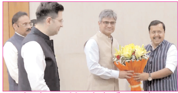
भाजपा के राष्ट्रीय अध्यक्ष नितिन नवीन से पार्टी मुख्यालय में मुलाकात करते राज्यसभा सांसद राघव चड्ढा, सदीप पाठक और अशोक मिश्र