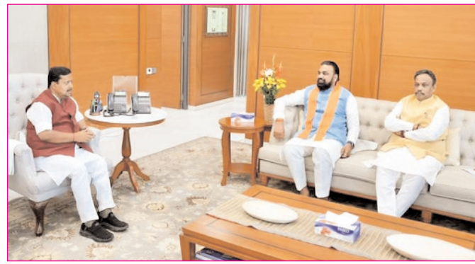
नयी दिल्ली में भाजपा के राष्ट्रीय अध्यक्ष नितिन नवीन से मुलाकात करते बिहार के सीएम सम्राट चौधरी

* रजि. नंबर : 52290/90 * वर्ष : 36 * अंक : 323 * पृष्ठ : 12 * औरंगाबाद, बुधवार, 22 अप्रैल 2026 * मूल्य : 3.00 रुपये * औरंगाबाद, पटना एवं बोकारो से प्रकाशित * www.navbihartime.com