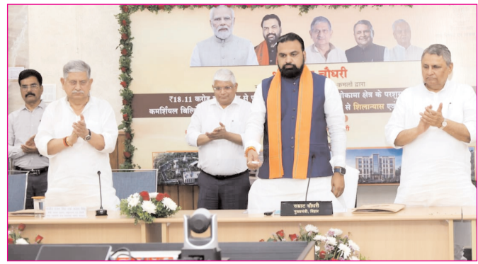
पटना के मोकामा में कमर्शियल बिल्डिंग निर्माण योजना का शिलान्यास करते सीएम सम्राट चौधरी

* पटना संस्करण * रजि. नंबर : 52290/90 * वर्ष : 36 * अंक : 322 * पृष्ठ : 12 * औरंगाबाद, मंगलवार, 21 अप्रैल 2026 * मूल्य : 3.00 रुपये * औरंगाबाद, पटना एवं बोकारो से प्रकाशित * www.navbihartime.com