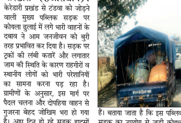
दबाव सुरक्षा व्यवस्था पर गंभीर सवाल खड़े करता है। केरेडारी के उपप्रमुख अमेरिका महतो ने इस मुद्दे पर कड़ी प्रतिक्रिया देते हुए कहा कि हजनाता की सुरक्षा के साथ खिलवाड़