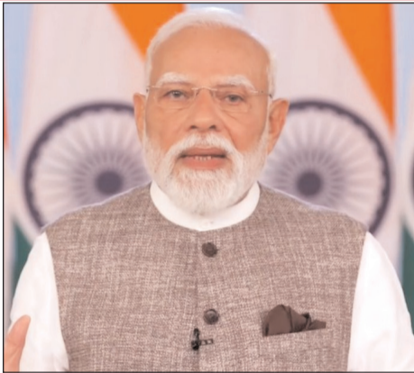
टीएमसी के पास भी बंगाल के लोगों को आगे बढ़ाने का मौका था लेकिन उन्होंने यह मौका गंवा दिया। सपा के पास भी मौका था कि वह महिला विरोधी होने के दग को धो

और राज करो, कांग्रेस यह राजनीति अंग्रेजों से विरासत में सीख कर आई है और उसी के सहारे आज भी चल रही है। कांग्रेस ने हमेशा देश में दरार पैदा करने वाली भावनाओं को हवा दी है। इसलिए यह झूठ फैलाया गया कि परिशीलन से कुछ राज्यों को नुकसान होगा जबकि सरकार ने पहले दिन से स्पष्ट किया है कि न किसी राज्य की भागीदारी का अनुपात बदलेगा न किसी का प्रतिनिधित्व कम होगा बल्कि सभी राज्यों की सीटें समान अनुपात में बढ़ेंगी। फिर भी कांग्रेस, डीएमके, टीएमसी और सपा जैसे दल इसे मानने के लिए तैयार नहीं हुए। यह संशोधन विधेयक सभी दलों के लिए एक मौका था। अगर यह पारित होता तो तमिलनाडु, बंगाल, यूपी सभी राज्यों की सीटें बढ़तीं लेकिन अपनी स्वार्थी राजनीति के लिए इन राज्यों ने अपने लोगों को भी धोखा दे दिया। डीएमके के पास मौका था कि वह और ज्यादा तमिल लोगों को संसद बना सकती थी और तमिल लोगों की आवाज मजबूत कर सकती थी।