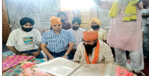
ज्ञान परंपरा को सुरक्षित रखना और उसे आम लोगों तक पहुंचाना है। इस मौके पर गुरुद्वारा के प्रधान द्वारा डीएम को सम्मान स्वरूप हस्तिरोपाह भेंट किया गया। वहीं गुरुद्वारा के हेड ग्रंथी द्वारा डीएम को हस्तलिखित गुरु ग्रंथ साहिब