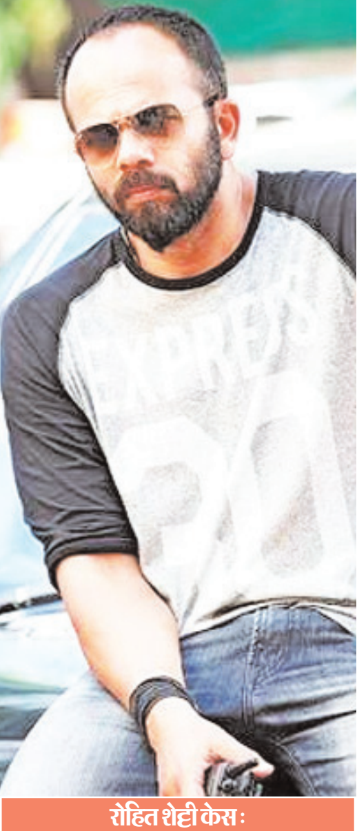
रोहित शेट्टी केस: