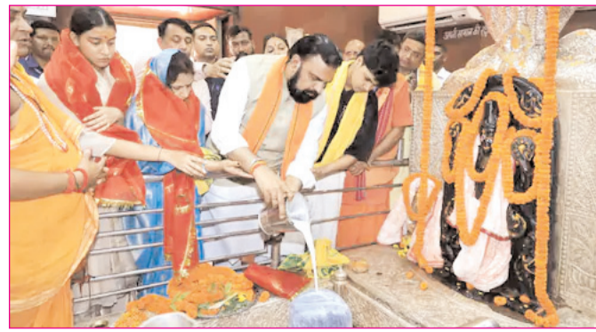
सनोपुर स्थित हरिहरनाथ मंदिर में परिवार के साथ पूजा करते सीएम सम्राट चौधरी

* मूल्य : 3.00 रुपये * औरंगाबाद, पटना एवं बोकारो से प्रकाशित * www.navbihartime.com