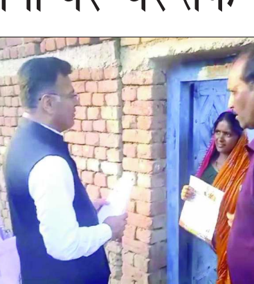
गुमला। जिला अंतर्गत चैनपुर प्रखंड स्थित सोकराहा गाँव में सोलर पैनल की मरम्मत करते हुए 96 घरों को 24 किलो वॉट बिजली से सफलता पूर्वक अच्छादित किया गया। वहीं चैनपुर प्रखंड स्थित कारामनी टोला में भी पूर्व में लगाए गए सोलर पैनल की मरम्ती करते हुए 100 घरों को 25 किलो वॉट बिजली से सफलता पूर्वक अच्छादित किया गया है। जिला प्रशासन ने उक्त गांव को सात वर्ष पूर्व दिन दयाल उपाध्याय ग्राम ज्योति योजना से अच्छादित करते हुए सोलर पैनल की सुविधा से बिजली उपलब्ध कराई गई थी। मगर मेटेस के अभाव कुछ सालों से सोलर पैनल खराब हो गई थी जिसे देखते हुए राज्य सरकार एवं जिला प्रशासन के संयुक्त पहल से उक्त गांव में लगे सोलर पैनल का पुनः मरम्ती करवाते हुए ग्रामीणों को बिजली की सुविधा से अच्छादित कर दिया गया है।