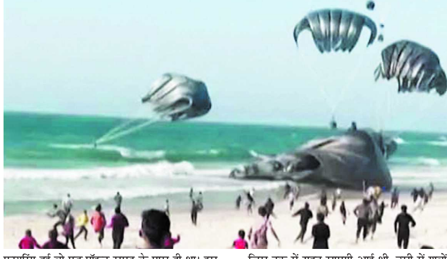
फायरिंग हुई वो एड पॉइंट समुद्र के पास ही था। इस दौरान 112 लोगों की मौत हुई थी। जिस ट्रक में राहत सामग्री आई थी, उसी में शवों को ले जाया गया था

7 अक्टूबर 2023 को शुरू हुई इजराइल-हमास जंग में अब तक 24 अस्पताल और 123 एम्बुलेंस तबाह हो चुकी हैं। कोई गाड़ी नहीं होने के कारण 1 मार्च को घायल हुए लोगों और शवों को गधा गाड़ी से अस्पताल ले जाया गया था। इसके अलावा जिस ट्रक में राहत सामग्री पहुंची थी उसमें भी शवों और घायलों को अस्पताल पहुंचाया गया था। जंग में अब तक 30 हजार से ज्यादा फिलिस्तीनी मारे जा चुके हैं।