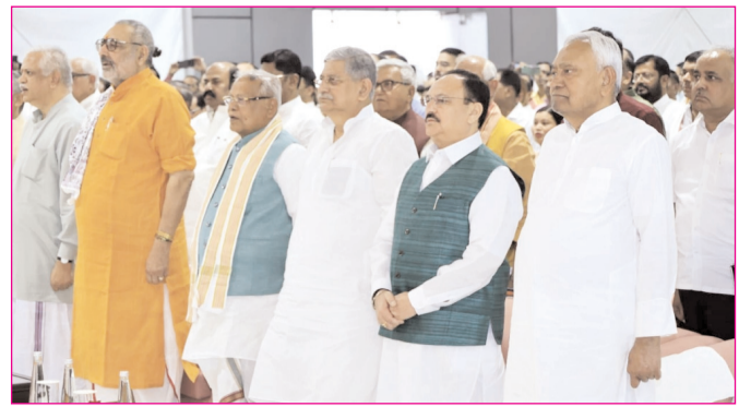
बिहार में नई सरकार के शपथ ग्रहण के दौरान लोक भवन में उपस्थित अतिथिगण