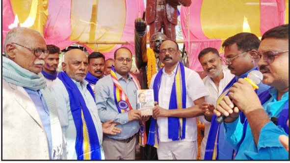
भव्य झांकी के साथ रात्रि संस्कृति कार्यक्रम का आयोजन