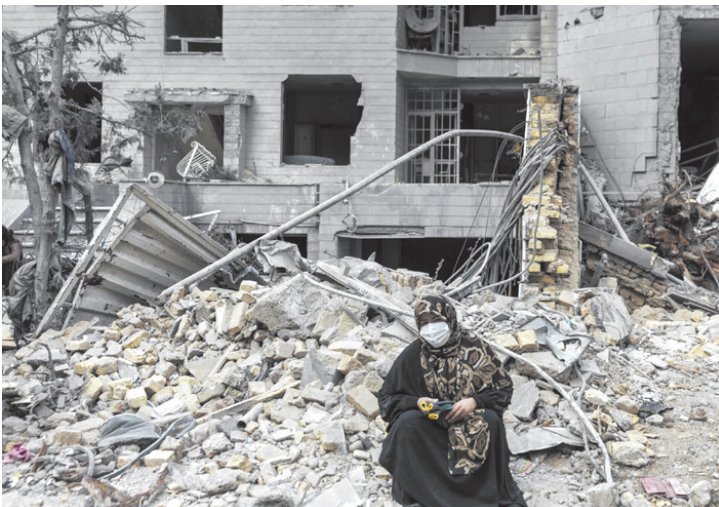
असुरक्षा का सामना करना पड़ा

फिर भी, उर्वरकों का प्रश्न अत्यंत महत्वपूर्ण है। नाइट्रोजन, फॉस्फेट और पोटेशिया, ये तीनों कृषि के आधार स्तंभ हैं। इनमें से नाइट्रोजन का उत्पादन सबसे अधिक ऊर्जा-निर्भर है। यदि गैस की कीमतें बढ़ती हैं, तो उर्वरकों की कीमतें भी आसमान छूने लगती हैं। पहले भी ऐसा हो चुका है जब उर्वरकों के दाम अचानक कई गुना बढ़ गए थे, जिससे किसानों को अपनी लागत कम करने के लिए मजबूर होना पड़ा। लेकिन कृषि एक धीमी प्रक्रिया है; इसका प्रभाव तुरंत नहीं दिखता। यदि आज उर्वरकों की कमी होती है, तो उसका असर अगली फसल में दिखेगा, वह भी धीरे-धीरे। इसके अलावा, किसान पूरी तरह उर्वरकों का उपयोग बंद नहीं कर देते, बल्कि उनकी मात्रा कम कर देते हैं। इससे उत्पादन में गिरावट आती है, परंतु यह गिरावट अचानक और विनाशकारी नहीं होती।