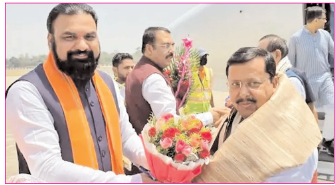
पटना एयरपोर्ट पर भाजपा के राष्ट्रीय अध्यक्ष नितिन नवीन का स्वागत करते सम्राट चौधरी