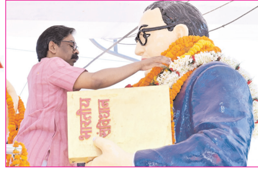
भारतीय संविधान निर्माता भारत रत्न डॉ भीम राव अम्बेडकर की जयंती पर श्रद्धासुमन अर्पित करते सीएम हेमंत सोरेन