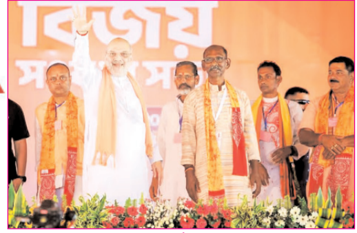
पश्चिम बंगाल के कोटासुर सैथिया में भाजपा प्रत्याशियों के साथ केन्द्रीय गृह मंत्री अमित शाह