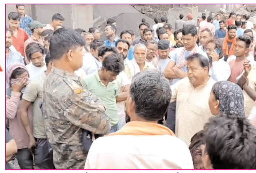
धनबाद में सीमेंट फैक्ट्री के कर्मियों की मौत के बाद प्रदर्शन कर रहे लोगों से वार्ता करते पुलिस पदाधिकारी