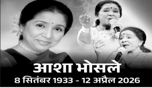
आशा भोसले 8 सितंबर 1933 - 12 अप्रैल 2026

नवबिहार टाइम्स ब्यूरो मुम्बई। रविवार को भारतीय संगीत जगत को गहरा आघात लगा है। दिग्गज गायिका आशा भोसले का निधन हो गया है। शनिवार को तबीयत खराब होने के बाद उन्हें अस्पताल में भर्ती कराया गया था। गायिका को थकान और सीने में संक्रमण की तकलीफ थी। फैंस आस लगाए बैठे थे कि उपचार के बाद वे स्वस्थ होकर लौटेंगी, मगर यह आस टूट गई। सुरों की दुनिया पर दशकों तक राज करने वाली महान गायिका आशा भोसले के निधन से देशभर में शोक की लहर दौड़ गई है। उनके जाने से संगीत का एक स्वर्णम युग मानो थम सा गया है। उनके निधन पर राष्ट्रपति-प्रधानमंत्री समेत कई दिग्गजों ने वी शोक श्रद्धांजलि व्यक्त की है। भारत की प्रतिष्ठित गायिका आशा भोसले के निधन पर राष्ट्रपति द्रौपदी मुर्मू ने गहरा शोक व्यक्त किया है। उन्होंने कहा कि आशा भोसले के जाने से संगीत जगत में एक ऐसा खालीपन पैदा हुआ है, जिसे भर पाना असंभव है। उनकी अद्वितीय गायकी ने भारतीय संगीत के एक पूरे युग को परिभाषित किया। प्रधानमंत्री नरेंद्र मोदी ने प्रख्यात गायिका आशा भोसले के निधन पर गहरा शोक व्यक्त किया है। उन्होंने कहा कि आशा भोसले भारत