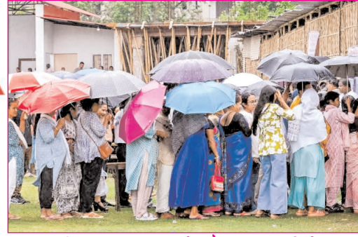
असम विधानसभा चुनाव के दौरान गुवाहाटी में एक पोलिंग बूथ पर वोट डालने के लिए लाइन में लगे लोग