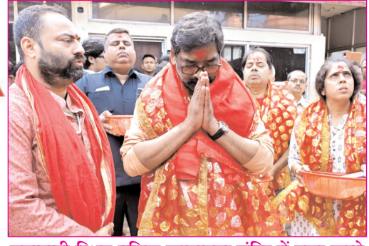
गुवाहाटी स्थित प्रसिद्ध कामाख्या मंदिर में पूजा करते झारखंड के मुख्यमंत्री हेमंत सोरेन