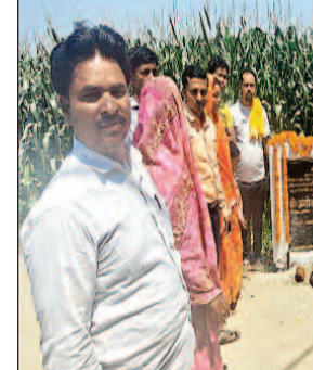
उसको दूर कर दिया गया है सड़क के बन जाने से स्थानीय लोगों के आवागमन में पिछले कई वर्षों से जो कठिनाई उत्पन्न हो रही थी अब