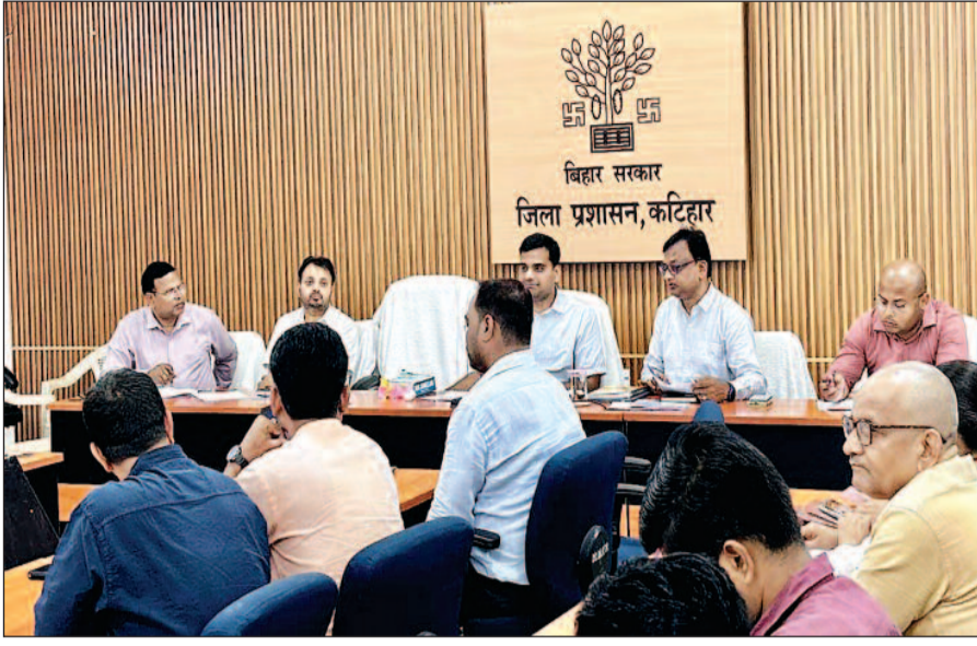
श्रम अधीक्षक को बाल श्रम विमुक्त करायें गये 14 वर्ष से कम आयु के बच्चों की सूची जिला शिक्षा पदाधिकारी को

नवबिहार टाइम्स संवाददाता कटिहार। समाहरणालय सभागार में जिला पदाधिकारी आशुतोष द्विवेदी की अध्यक्षता में आयोजित बैठक जिला बाल श्रम निषेध टास्क फोर्स एवं जिला बाल संरक्षण इकाई के कार्यों की समीक्षा की गई। बाल श्रम विमुक्त करायें गये बालकों की समीक्षा के दौरान जिला पदाधिकारी ने श्रम अधीक्षक को होटलों, ढाबों, दुकानों, ईट भट्टों एवं अन्य प्रतिष्ठानों में विशेष अभियान चलाकर बाल श्रम से जुड़े बच्चों का रेस्क्यू करने का निर्देश दिया वहीं उन्होंने सरकार द्वारा निर्धारित राहत की राशि ससमय बच्चों को उपलब्ध कराना सुनिश्चित किये जाने की भी बात कही। इसके लिए ससमय सभी लाभकों का खाता खुलवाना सुनिश्चित किया जाय। डीएम ने