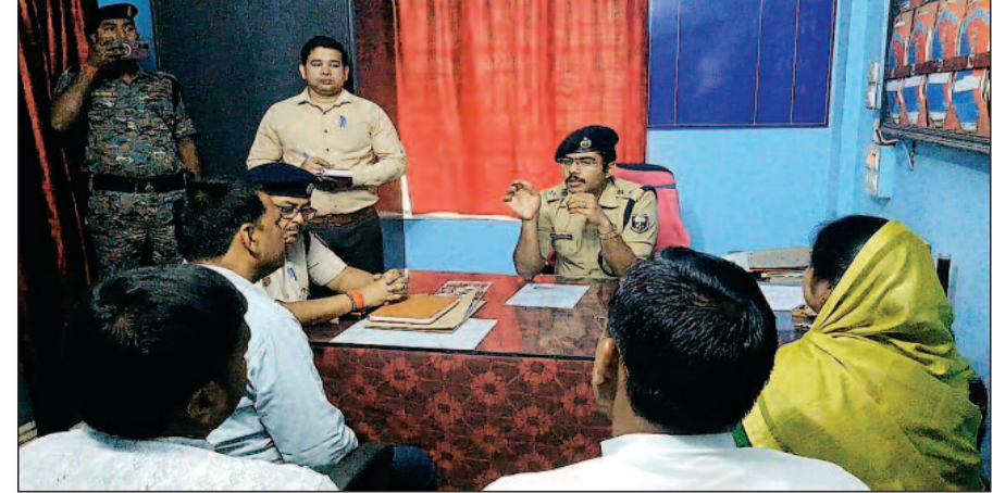
दोनों को तत्काल सस्पेंड कर दिया है। मानवाधिकार के प्रक्रिया के हिसाब जांच कराई जा रही है। न्यायालय एवं मानवाधिकार को भी घटना की सूचना दे दी गई है। साथ ही जिले के एफएसएल व डीआईयू