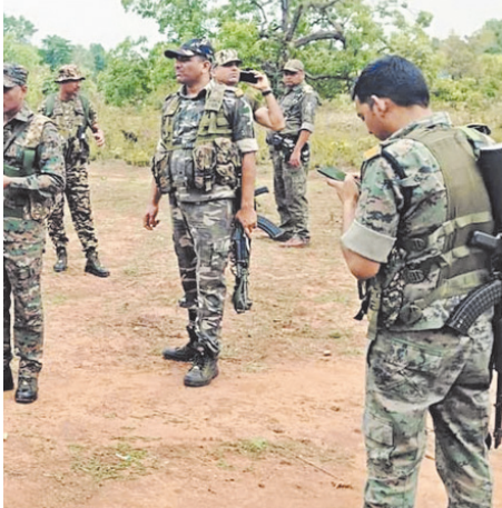
और कौशल केंद्र बनाए गए। उन्होंने कहा कि विकास ही नक्सलवाद खत्म करने का सबसे बड़ा कारण बना।

शाह ने कहा कि नक्सलवाद गरीबी से नहीं, बल्कि विचारधारा से पैदा हुआ। उन्होंने कहा कि यह विचारधारा लोकतंत्र में विश्वास नहीं करती और बंदूक के जरिए सत्ता चाहती है। उन्होंने यह भी कहा कि आदिवासियों को बरालाकर उनके हाथ में हथियार दिए गए और विकास को रोका गया। गृह मंत्री ने कहा कि सरकार आगे भी सख्ती और विकास दोनों पर काम जारी रखेगी। उन्होंने आदिवासी समाज को भरोसा दिलाया कि उनकी सुरक्षा और विकास सरकार की प्राथमिकता है। उन्होंने कहा कि अब देश बंदूक से नहीं, संविधान से चलेगा और यही असली जीत है। गृह मंत्री के अनुसार, जिस 'रेड कॉरिडोर' का विस्तार कभी पशुपति से तिरुपति तक माना जाता था, वह अब सिमटकर केवल कुछ जिलों तक रह गया है। 2014 में जहाँ 126 जिले वामपंथी उग्रवाद से प्रभावित थे, वहीं 2025-26 तक यह संख्या घटकर मात्र एक अंक में रह गई है। छत्तीसगढ़ बलों के नियंत्रण में है और वहाँ विकास की किरणें पहुँच रही हैं। सरकार के इन दावों की पुष्टि जमीनी आंकड़ों से भी होती है। पिछले कुछ वर्षों में नक्सली हिंसा की घटनाओं में 70 प्रतिशत से अधिक की कमी आई है। सुरक्षा बलों की शाहदत के आंकड़ों में भी भारी गिरावट दर्ज की गई है। 'ऑपरेशन कणाग' और