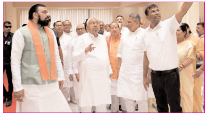
पटना में नवनिर्मित विधान परिषद् अतिथि निवास का अवलोकन करते सीएम नीतीश कुमार

* पटना संस्करण * रजि. नंबर : 52290/90 * वर्ष : 36 * अंक : 308 * पृष्ठ : 12 * औरंगाबाद, मंगलवार, 7 अप्रैल 2026 * मूल्य : 3.00 रुपये * औरंगाबाद, पटना एवं बोकारो से प्रकाशित * www.navbihartime.com