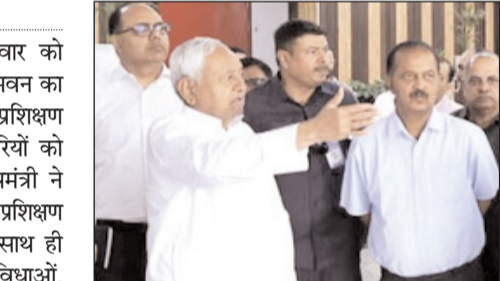
दिया जा रहा है। उन्होंने बड़े ही सहज अंदाज में छात्रों को प्रोत्साहित करते हुए कहा कि यदि वे मन

नवबिहार टाइम्स ब्यूरो पटना। मुख्यमंत्री नीतीश कुमार ने बुधवार को पटना स्थित बिपार्ड स्किल पार्क के दक्षता भवन का निरीक्षण किया। इस दौरान उन्होंने प्रशिक्षण व्यवस्थाओं का जायजा लेते हुए अधिकारियों को जरूरी दिशा-निर्देश दिए। इस दौरान मुख्यमंत्री ने वाल्मी परिवार में संचालित विभिन्न कौशल प्रशिक्षण कार्यक्रमों का विस्तृत अवलोकन किया। साथ ही प्रशिक्षुओं के लिए उपलब्ध आवासीय सुविधाओं, मेस व्यवस्था और छात्रावासों की स्थिति का भी निरीक्षण किया। उन्होंने हिमाद्री छात्रावास समेत अन्य हॉस्टलों की व्यवस्थाओं की जानकारी ली और परिवार को सुव्यवस्थित रखने के निर्देश दिए। निरीक्षण के दौरान मुख्यमंत्री ने कक्षाओं में पढ़ रहे प्रशिक्षुओं से बातचीत की और उन्हें मन लगाकर प्रशिक्षण लेने के लिए प्रेरित किया। उन्होंने कहा कि राज्य सरकार युवाओं को रोजगार और स्वरोजगार से जोड़ने के लिए लगातार प्रयासरत है और कौशल विकास के जरिए उन्हें आत्मनिर्भर बनाने पर जोर