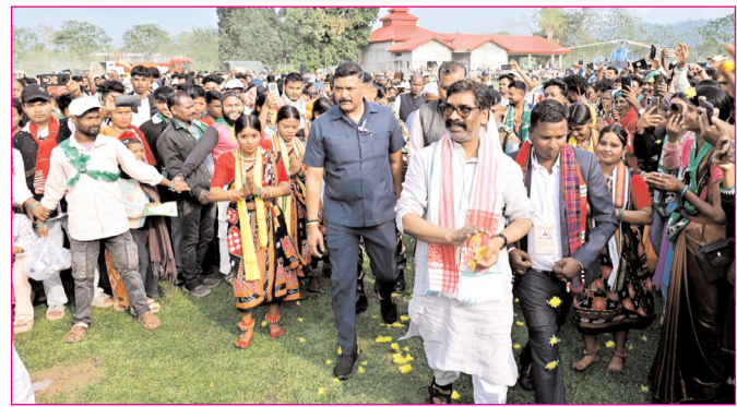
असम के तिनसुकिया में चुनाव प्रचार के दौरान लोगों से मिलते झारखंड के सीएम हेमंत सोहन

* पटना संस्करण * रजि. नंबर : 52290/90 * वर्ष : 36 * अंक : 303 * पृष्ठ : 12 * औरंगाबाद, गुरुवार, 2 अप्रैल 2026 * मूल्य : 3.00 रुपये * औरंगाबाद, पटना एवं बोकारो से प्रकाशित * www.navbihartime.com