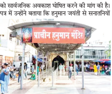
को अटूट आस्था जुड़ी है। इस दिन दिल्ली के विभिन्न