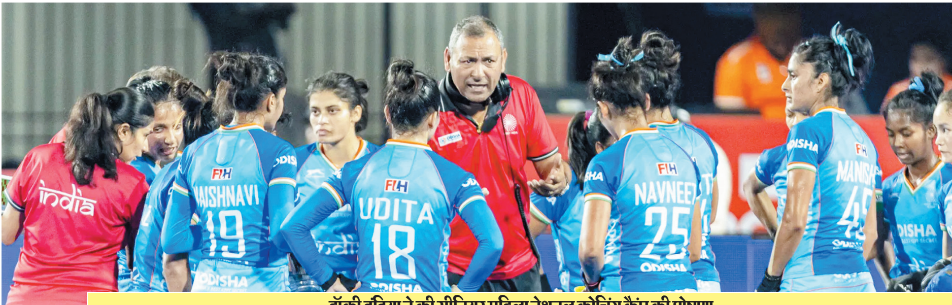
हॉकी इंडिया ने की सीनियर महिला नेशनल कोचिंग कैंप की घोषणा

ओवर के स्पेल में बिना कोई विकेट चटकाए 51 रन खर्च किए। अफगानी गेंदबाज ने 12.80 की इकोनॉमी से रन खर्च किए। आईपीएल के डेब्यू मुकाबले में सबसे महंगा स्पेल फेंकने का शर्मनाक रिकॉर्ड प्रयास रे बर्मन के नाम दर्ज है। उन्होंने साल 2019 में रॉयल चैलेंजर्स बेंगलुरु की ओर से खेलते हुए सनराइजर्स हैदराबाद के खिलाफ 4 ओवर में 56 रन दिए थे। गजनफर केकेआर के खिलाफ अपनी लाइन और लेंथ से भटके नजर आए, जिसका भरपूर फायदा कोलकाता के बल्लेबाजों ने उठाया। गजनफर को आईपीएल 2025 के ऑक्शन में मुंबई ने 4.80 करोड़ रुपये में खरीदा था। वहीं, आईपीएल 2026 के लिए टीम ने उन्हें रिटैन किया था। वानखेड़े के मैदान पर मुंबई इंडियंस ने कोलकाता नाइट राइडर्स के खिलाफ अपना शानदार रिकॉर्ड जारी रखा। पहले बल्लेबाजी करते हुए केकेआर ने 20 ओवर में 4 विकेट गंवाकर स्कोरबोर्ड पर 220 रन लगाए। टीम की तरफ से कप्तान अजिंक्य रहाणे ने 40 गेंदों में 67 रनों की दमदार पारी खेली जबकि अंगकृष रघुवंशी ने 29 गेंदों में 51 रन बनाए।