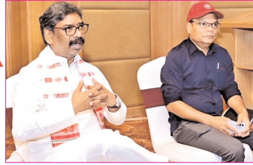
असम के डिब्रुगढ़ में झामुमो कार्यकर्ताओं के साथ आगामी विधानसभा चुनाव को लेकर संवाद करते मुख्यमंत्री हेमंत सोरेन