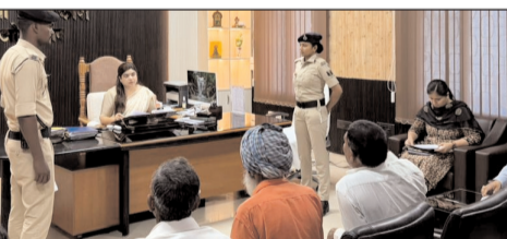
से दाखिल-खारिज, अतिक्रमण, राशन कार्ड, नाली-गली निर्माण, भूमि विवाद, आंगनबाड़ी सेविका बहाली, जमाबंदी, इंद्रिया आवास, भूमि मापों, जमीन पर अवैध कब्जा, परिमार्जन, एलपीसी निर्गत करने, पैक्स से संबंधित मामले, मानदेय भुगतान, आंगनबाड़ी बहाली में अनियमितता, अनुग्रह आवेदन सहित अन्य जनहित से जुड़े विषय शामिल रहे। जनता दरबार में प्राप्त सभी परिवारों को विधिवत पंजी में दर्ज कर संबंधित विभागों को अग्रसारित किया गया तथा संबंधित पदाधिकारियों को त्वरित एवं आवश्यक कार्रवाई सुनिश्चित करने के निर्देश दिए गए। जिला प्रशासन द्वारा यह सुनिश्चित किया जा रहा है कि सभी मामलों का निष्पादन त्वरित समय-सीमा के भीतर किया जाए ताकि आम नागरिकों को अपनी समस्याओं के समाधान के लिए अनावश्यक विलंब न हो। जिलाधिकारी ने उपस्थित सभी संबंधित पदाधिकारियों को स्पष्ट निर्देश देते हुए कहा कि प्रत्येक परिवार का गुणवत्तापूर्ण, निष्पक्ष एवं न्यायसंगत निष्पादन सुनिश्चित किया जाए।