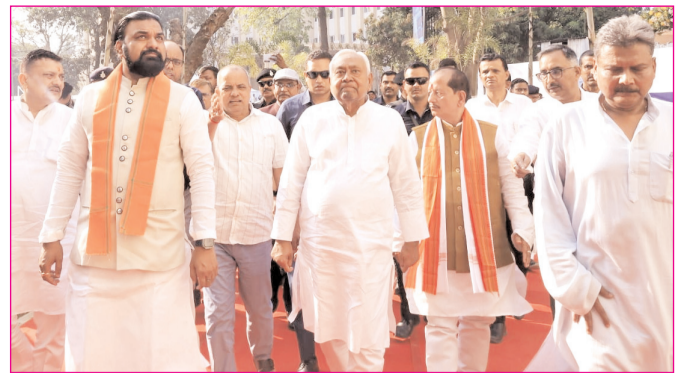
पटना विश्वविद्यालय के नवनिर्मित भवन का निरीक्षण करते सीएम नीतीश कुमार

* रजि. नंबर : 52290/90 * वर्ष : 36 * अंक : 301 * पृष्ठ : 12 * औरंगाबाद, मंगलवार, 31 मार्च 2026 * मूल्य : 3.00 रुपये * औरंगाबाद, पटना एवं बोकारो से प्रकाशित * www.navbihartime.com