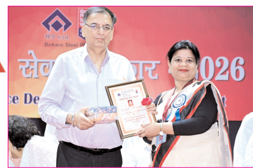
बोकारो इस्पात संघर्ष में दीर्घकालीन सेवा पुरस्कार समारोह का आयोजन कर कर्मियों को किया गया सम्मानित