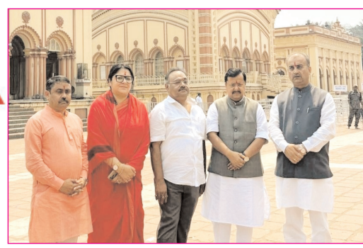
कोलकाता स्थित पवित्र दक्षिणेश्वर काली मंदिर में मां भवतारिणी का दर्शन करते भाजपा के राष्ट्रीय अध्यक्ष नितिन नवीन एवं अन्य