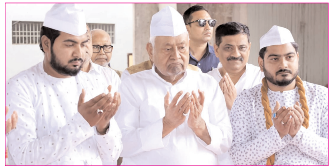
ईद के अवसर पर पटना सिटी स्थित खानकाह-ए-मुनएफिया में राज्य की सुख-शांति एवं समृद्धि की दुआ करते मुख्यमंत्री नीतीश कुमार