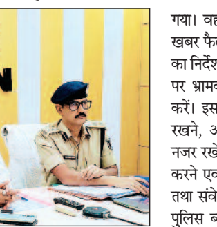
बार भी जुलूस निकाला जाएगा। जुलूस के शांतिपूर्ण निकाले जाने के निमित्त जिला पदाधिकारी एवं पुलिस अधीक्षक को विशेष सावधानी बरतने का निर्देश दिया गया। नजर से ही जुलूस के रूट का भौतिक सत्यापन शांत प्रतिशत करने का निर्देश दिया गया। जुलूस के रास्ते में जर्जर बिजली के तारों को बदलवाने का निर्देश भी दिया गया। बिजली की निर्बाध आपूर्ति सुनिश्चित करने का भी निर्देश दिया