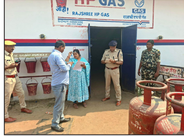
नवबिहार टाइम्स ब्यूरो