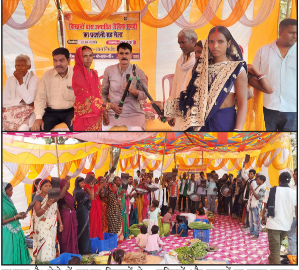
सुधारना है। मेले में लाभुक किसानों ने अपने-अपने खेतों में उपजाई गई जैविक