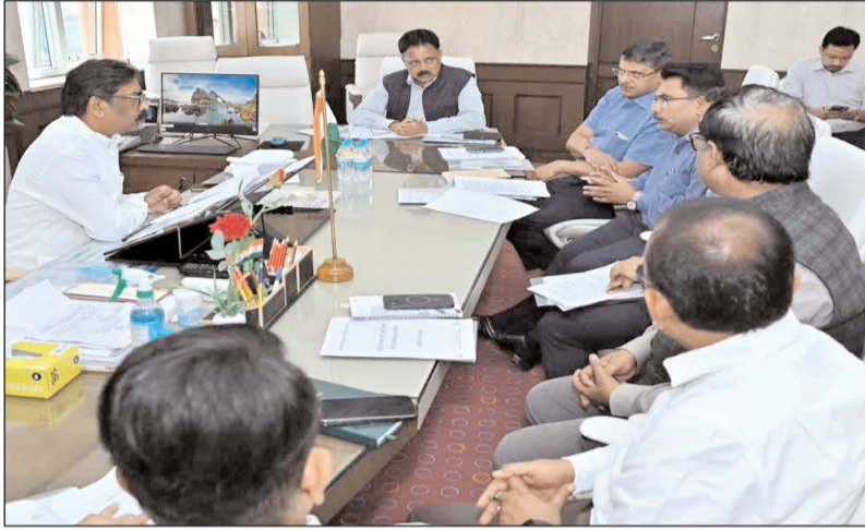
न सिर्फ पर्यावरण संरक्षण को बढ़ावा मिलेगा बल्कि स्थानीय लोगों के लिए रोजगार के नए अवसर भी सृजित होंगे। उन्होंने अधिकारियों को यह भी निर्देश दिया कि चयनित स्थलों पर बेहतर

रांची। झारखंड में इको टूरिज्म के विकास को लेकर सरकार अब तेजी से आगे बढ़ने की तैयारी में है। मुख्यमंत्री हेमंत सोरेन की अध्यक्षता में झारखंड इको टूरिज्म अथॉरिटी यानी जेटा की चौथी बैठक मंगलवार को विधानसभा स्थित सीएम के कक्ष में हुई। बैठक के दौरान राज्य के प्राकृतिक स्थलों को पर्यटन के नक्शे पर लाने की दिशा में अहम फैसले लिए गए। बैठक में मुख्यमंत्री ने स्पष्ट निर्देश दिया कि जिन क्षेत्रों में इको टूरिज्म की बेहतर संभावनाएं हैं वहां प्राथमिकता के आधार पर स्थलों की पहचान की जाए। इसके साथ ही वन, पर्यटन और जल संसाधन विभाग को आपसी समन्वय के साथ टोस कार्यक्रम तैयार करने को कहा गया। मुख्यमंत्री ने कहा कि झारखंड प्राकृतिक सौंदर्य से भरपूर राज्य है और यहां इको टूरिज्म के जरिए