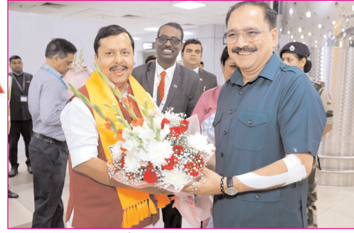
राज्यसभा सदस्य निर्वाचित होने के बाद पहली बार दिल्ली पहुंचे भाजपा अध्यक्ष नितिन नवीन का एयरपोर्ट पर हुआ भव्य स्वागत

झारखंड में इको टूरिज्म को मिलेगी रफ्तार, मुख्यमंत्री ने तय की विकास की नई रूपरेखा