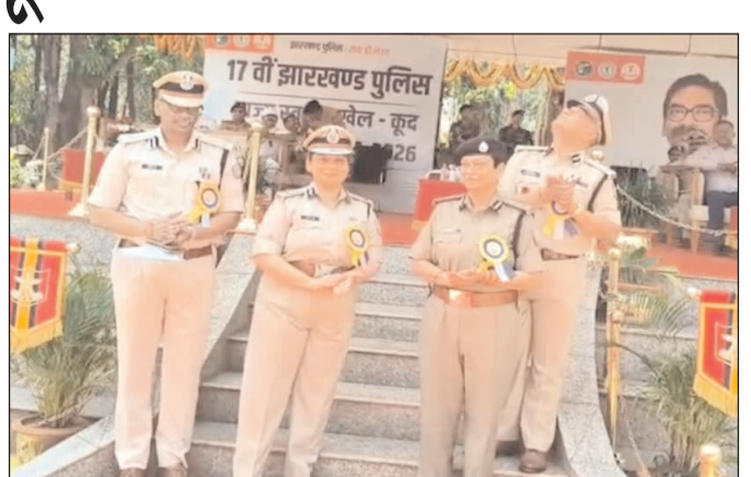
हॉकी, फुटबॉल, एथलेटिक्स, भारोत्तोलन, मुक्केबाजी, तीरंदाजी, कुरुती, जिमनास्टिक, कराटे, कबड्डी, योगा, बैडमिंटन और टेबल टेनिस शामिल हैं। विभिन्न प्रतियोगिताएं रांची के प्रमुख खेल