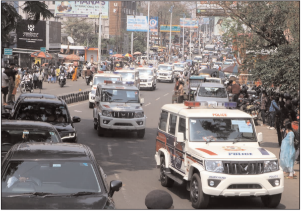
करते हुए लोगों को आगामी त्योहार शांतिपूर्ण और सौहार्दपूर्ण वातावरण में मनाने की अपील की।