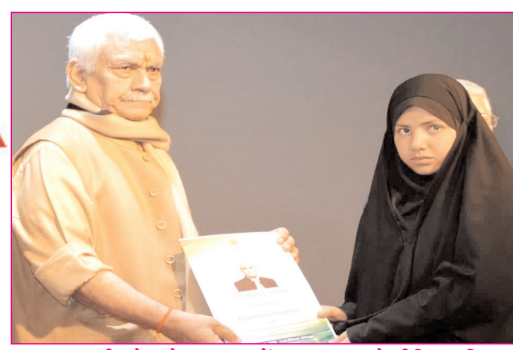
जम्मू-कश्मीर के लोक भवन में आतंकवाद से पीड़ित परिजन को सरकारी नियुक्ति पत्र सौंपते उपराज्यपाल मनोज सिन्हा