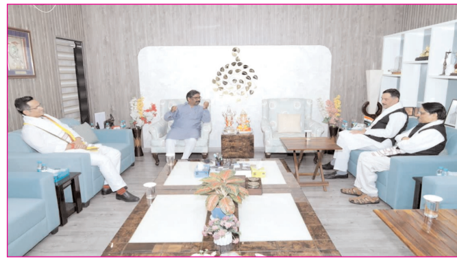
रांची के कांके रोड स्थित आवास पर कांग्रेस नेताओं से बात करते सीएम हेमंत सोरेन

* मूल्य : 3.00 रुपये * औरंगाबाद, पटना एवं बोकारो से प्रकाशित * www.navbihartime.com