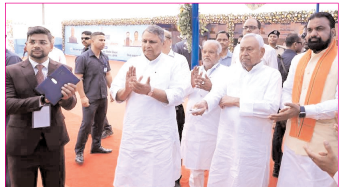
पूर्णिया में विकास योजनाओं का उद्घाटन एवं शिलान्यास करते मुख्यमंत्री नीतीश कुमार

* मूल्य : 3.00 रुपये * औरंगाबाद, पटना एवं बोकारो से प्रकाशित * www.navbihartime.com