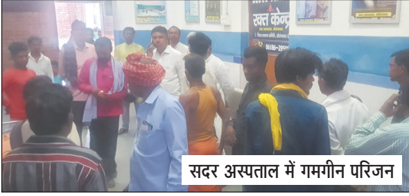
सदर अस्पताल में गमगीन परिजन

पदाधिकारी और दंडधिकारियों की प्रतिनियुक्ति की गई है। इसके साथ-साथ मेला स्थल पर मेडिकल कैम्प भी लगेगा जिसमें पारा मेडिकल टीम आवश्यक दवाओं, ओआरएस के घोल आदि के साथ 24 घंटे तैनात रहेगी। गौरतलब है कि चैती छठ व्रत के दौरान देव आकर छठ व्रत करने की विशिष्ट धार्मिक और आध्यात्मिक महत्ता है। लोक मान्यता है कि यहां प्रति वर्ष दो बार कार्तिक और चैत माह में छठ व्रत के दौरान छठव्रतियों तथा श्रद्धालुओं को भगवान भास्कर की उपस्थिति की रोमांचक अनुभूति होती है। यहां का कथित त्रेतायुगीन सूर्य मंदिर वास्तुकला का न केवल अप्रतिम उदाहरण है बल्कि देशी-विदेशी करोड़ों श्रद्धालुओं की अटूट आस्था का केन्द्र भी है।