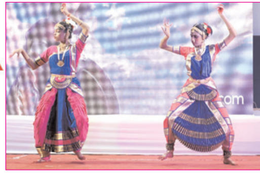
बोकरो इत्याद संयंत्र के बीजीएच के नर्सिंग स्टाफ द्वारा अंतर्राष्ट्रीय महिला दिवस पर दी गई नर्थांग इज इम्पॉसिबल नृत्य की शानदार प्रस्तुति