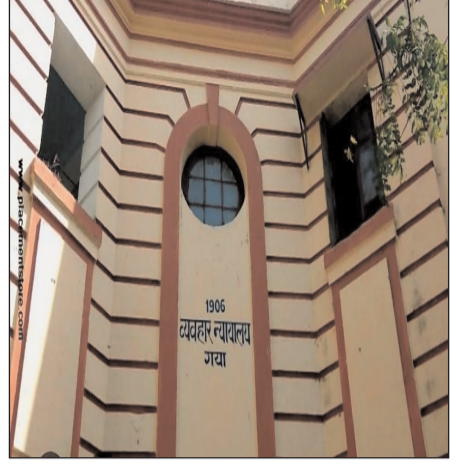
उच्च न्यायालय के बेंच स्थापित होने से गया जी सहित मध्य- दक्षिण बिहार के दर्जन भर जिला के लोगों को काफी सहूलियत होगी। नेताओं ने कहा कि गयाजी व्यवहार न्यायालय के नाए भवन का निर्माण अधिवक्ताओं के बैठने की मुकलम व्यवस्था सहित आमजनों के लिए सभी प्रकार की सुविधा मुहैया कराना भी नितांत आवश्यक है।