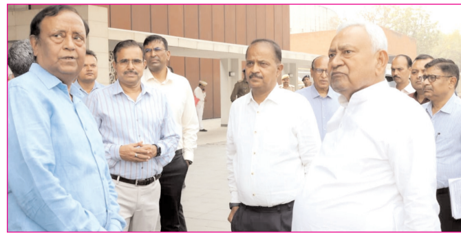
पटना में बिहार संग्रहालय के सामने पुनर्विकसित किए जा रहे 60 आवास एवं अफिसर्स हास्टल कैम्पस तथा पार्क के निर्माण कार्य को लेकर स्थल निरीक्षण करते मुख्यमंत्री नीतीश कुमार

* मूल्य : 3.00 रुपये * औरंगाबाद, पटना एवं बोकारो से प्रकाशित * www.navbihartime.com