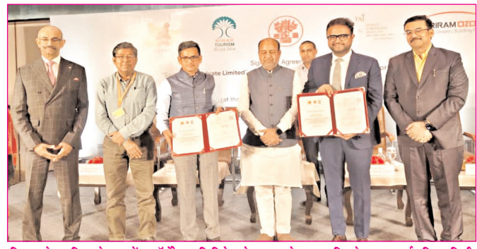
बिहार स्टेट टूरिज्म डेवलपमेंट कॉर्पोरेशन लिमिटेड ने साराहा होटल प्रा. लि. के साथ सार्वजनिक-निजी भागीदारी मॉडल के तहत पटना में होटल ताज के निर्माण के लिए समझौता पत्र पर किए हस्ताक्षर