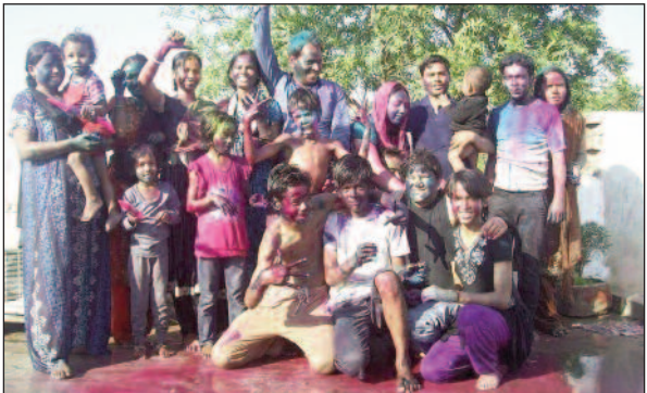
माहौल रहा।बच्चों से लेकर बुजुर्गों तक सभी ने एक-दूसरे को रंग और गुलाल लगाकर होली की शुभकामनाएं दीं।गांव की गलियों में ढोलक की थाप

मसौढ़ी/नवबिहार टाइम्स संवाददाता। गांव से लेकर शहर तक मसौढ़ी में होली का पर्व हर्षोल्लास और आपसी भाईचारे के साथ मनाया गया। मस्ती और उमंग का पर्व में हर्षोल्लास के साथ मनाया गया। रंग गुलाल से माहौल सवरंगी नजर आया। शहर की सड़कों पर दिनभर रंगीन चेहरे नजर आते रहे। होलियारों की टोलियां चौक-चौराहों पर जमकर धूम मचाया। रंग गुलाल उड़ते रहे और लोग रंग की मस्ती में डूबे रहे।इस पावन अवसर पर सुबह से ही मसौढ़ी, धनरूआ एवं पुनपुन के हर गांव में उत्सव जैसा