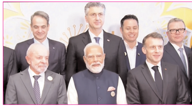
दिल्ली में आयोजित एआई इम्पैक्ट समिट में विदेशी प्रतिनिधियों के साथ पीएम नरेन्द्र मोदी