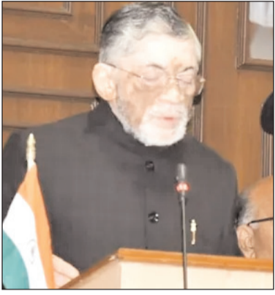
विकास मॉडल को प्रस्तुत किया। इसके बाद यूनाइटेड किंगडम, विशेषकर लंदन में उच्चस्तरीय बैठकों के माध्यम से निवेश संभावनाओं को मजबूत किया गया। इस संयुक्त पहल के तहत

विस्तार, गरीबों और कमजोर वर्गों का कल्याण, किसानों एवं महिलाओं का सशक्तिकरण तथा युवाओं के लिए रोजगार सृजन प्रमुख लक्ष्य हैं। सरकार ने कानून-व्यवस्था को सर्वोच्च प्राथमिकता देते हुए जीरो टॉलरेंस की नीति अपनाई है। वर्ष 2025 में साइबर अपराध के 1,413 मामलों में 1,268 अपराधियों की गिरफ्तारी की गई। साइबर हेल्पलाइन 1930 के माध्यम से 111 करोड़ रुपये की राशि ब्लॉक की गई, जबकि धारा 497 बीएनएस के तहत लगभग 12 करोड़ रुपये पीड़ितों को वापस कराए गए। भ्रष्टाचार के खिलाफ सख्त कार्रवाई करते हुए 54 लोकसेवकों की गिरफ्तारी भी की गई है। राज्य के औद्योगिक विकास को नई दिशा देने के लिए सरकार ने पहली बार वर्ल्ड इकोनॉमिक फोरम के दावोंस सम्मेलन में भाग लेकर निवेश-उन्मुख नीतियों और ग्रोथ इन हार्मनी विद नेचर आधारित