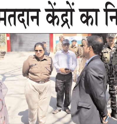
गया है। स्ट्रांग रूम डिस्पैच एरिया की क्या तैयारी है, इसका जायजा लिया गया है और समीक्षा की गई है। ट्रेफिक प्लान को भी देखा गया है और अगल-बगल के मतदान केंद्रों का निरीक्षण किया गया। मतदान केंद्र पर एंटी और एंजिट की सुविधा का भी जायजा लिया गया है एवं समीक्षा की गई है। एसपी रीष्मा रमेशन ने कहा कि प्रशिक्षण का कार्य पूरा हो गया है। डिस्पैच एरिया एवं स्ट्रांग रूम का जायजा लिया गया है। ट्रेफिक एवं विधि व्यवस्था का प्लान तैयार किया गया है। मतदान केंद्रों का भी निरीक्षण किया गया है और अधिकारियों को कई

गवबिहार टाइम्स ब्यूरो मेदिनीनगर। निकाय चुनाव को लेकर मतदान कर्मियों की ट्रेनिंग का कार्य पूरा हो गया है। बुधवार को मतदान कर्मियों की ट्रेनिंग का अंतिम दिन था। इस बार चुनाव बलेट पेपर से होना है। पलामू के पांच अलग-अलग क्षेत्रों में निकाय चुनाव होना है। पलामू के मेदिनीनगर में जीएलए कॉलेज में स्ट्रांग रूम बनाया गया है जबकि वहीं से मतदान कर्मियों को रवाना भी किया जाएगा। पलामू डीसी समीरा एस और एसपी रीष्मा रमेशन ने बुधवार को मतदान कर्मियों के प्रशिक्षण का जायजा लिया एवं कई बिंदुओं पर दिशा निर्देश दिए। इसके बाद डीसी और एसपी ने मेदिनीनगर नगर निगम क्षेत्र के कई मतदान केंद्रों का जायजा लिया। दोनों ने बहलोलवा, पहाड़ी और रेडमा पर्यापालन मतदान केंद्र का निरीक्षण किया है। इस दौरान मतदान केंद्र पर वोटों की सुविधा और सुरक्षा की समीक्षा की है। डीसी समीरा एस ने कहा कि पोलिंग पार्टी का तीसरा और अंतिम दिन का प्रशिक्षण कार्य पूरा हो