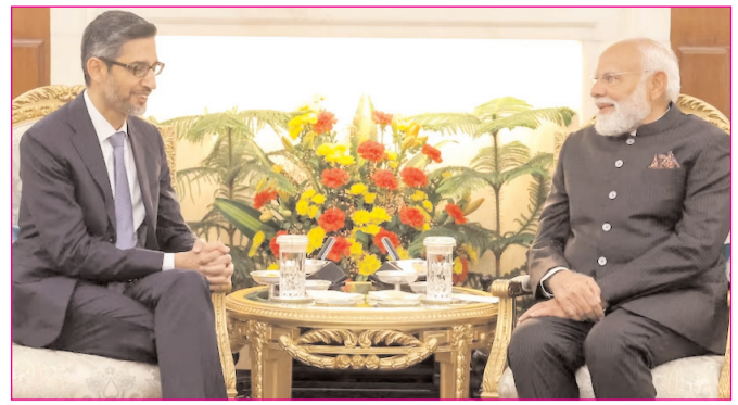
नवी दिल्ली में एआई ड्रेंट में हिस्सा लेने से पूर्व पीएम नरेन्द्र मोदी से मिलते सीइओ सुंदर पिचाई

* रजि. नंबर : 52290/90 * वर्ष : 36 * अंक : 263 * पृष्ठ : 12 * औरंगाबाद, गुरुवार, 19 फरवरी 2026 * मूल्य : 3.00 रुपये * औरंगाबाद, पटना एवं बोकारो से प्रकाशित * www.navbihartime.com