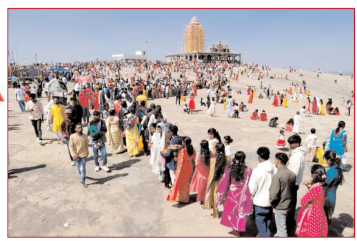
महाशिवरात्रि के अवसर पर नामकुम मरासिल्ली पहाड़ शिव धाम में उमड़ श्रद्धालु