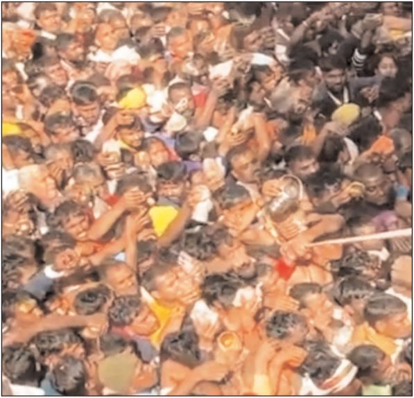
दुपहिया वाहन से भी जलाभिषेक और पूजा अर्चना करने के लिए भी पहुंचे। गुप्ताधाम में पेयजल की किल्लत के कारण लोगों को भारी

नवबिहार टाइम्स संवाददाता चेनारी (रोहतास)। महाशिवरात्रि के अवसर पर जिले के प्रसिद्ध गुप्ताधाम में महाशिवरात्रि पर भक्तों का जनसैलाब उमड़ा। लगभग दो लाख श्रद्धालुओं ने पवित्र शिवलिंग पर जलाभिषेक कर पूजा अर्चना की। सुबह 1 बजे से ही श्रद्धालुओं की जल्पा पहाड़ के विभिन्न रास्ते से होकर पहुंचा गुफा द्वारा के पास हाथ में बेलपत्र और जल लेकर धाम के पास स्थित सीता कुंड में स्नान करने के बाद गुफा स्थित पवित्र शिवलिंग पर जलाभिषेक कर पूजा अर्चना की। इस दौरान हर हर महादेव के नारे से रोहतास-कैमूर पहाड़ी की जंगल गुंज रही थी। गुप्ताधाम विकास कमेटी के सदस्यों द्वारा उन्हें कलाखंड दर्शन कराया गया। दुर्गावती जलाशय से होते हुए