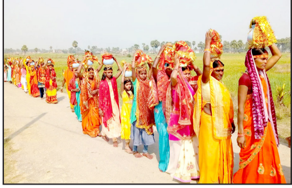
कार्यक्रम संपन्न होगा। इधर, बड़की मडहल में भी कलशयात्रा निकाली गई। कलशयात्रा के बाद 24 घण्टे का अखंड कीर्तन शुरू हुआ।