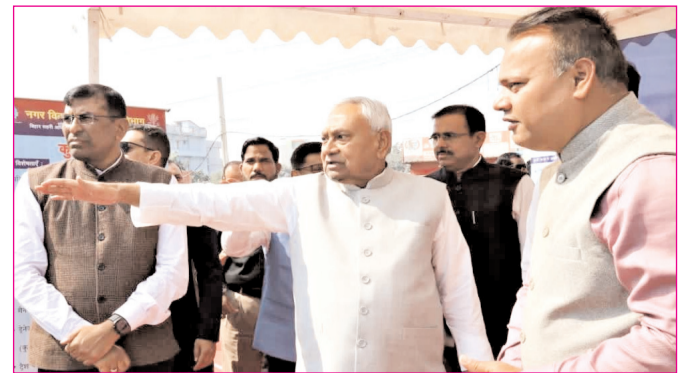
पटना में कुर्जी नाला निर्माण योजना का निरीक्षण करते सीएम नीतीश कुमार