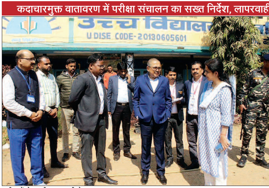
वीक्षण से स्पष्टीकरण, ड्यूटी से हटाने का निर्देश