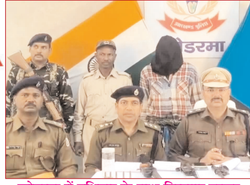
कोडरमा में हथियार के साथ गिरफ्तार तस्क़र