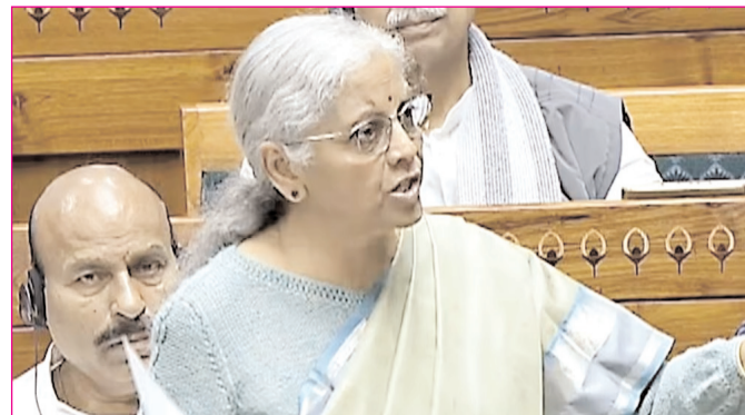
लोकसभा में बजट पर हुई चर्चा का जवाब देती वित्त मंत्री निर्मला सीतारमण

* रजि. नंबर : 52290/90 * वर्ष : 36 * अंक : 256 * पृष्ठ : 12 * औरंगाबाद, गुरुवार, 12 फरवरी 2026 * मूल्य : 3.00 रुपये * औरंगाबाद, पटना एवं बोकारो से प्रकाशित * www.navbihartime.com