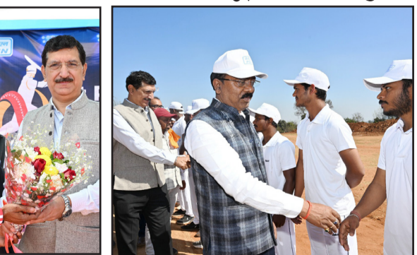
की 13 पंचायतों के मुखिया भी उपस्थित रहे। टूर्नामेंट में भाग लेने वाली सभी टीमों को खेल किट बैग वितरित किए गए, जिनमें खेल पोशाक एवं आवश्यक खेल सामग्री शामिल थी। विधायक ने इस आयोजन की सराहना करते हुए कहा कि ऐसे टूर्नामेंट क्षेत्र के युवाओं