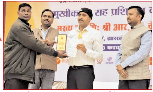
हजारोंबाग डाक प्रमंडल द्वारा आयोजित डाक महामेला में भारत सरकार की विभिन्न डाक सेवाओं और योजनाओं के बारे में जानकारी दी गई