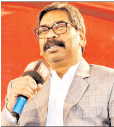
लड़ाई लड़ी है और उसको पाया है। झारखंड के लोगों ने देश और राज्य के इतिहास में बहुत योगदान दिया है। देश के आजाद होने और उसके बाद भी लोगों ने देश के लिए बहुत कुछ किया है। टाटा और बिरला जैसा समूह पहले हमारे राज्य में पहुंचे। इस देश के सर्वांगीण

रांची। आज के राजनेताओं का जेल जाना ईडी और सीबीआई के एक्शन के तहत है। अंत में तो जनता के दरबार में जाना होता है। हम तो सदैव जनता की अदालत में जाते हैं। आज आप व्यक्ति को बांध कर रख सकते हैं लेकिन विचारों को नहीं बांध सकते हैं। हमारी जेएमएम सिर्फ पार्टी नहीं बल्कि विचार है। राज्य बनने के बाद सूबे के प्रति संवेदनाएं दिखाई गईं होती तो ज्यादा बदलाव देखने को मिलते। यह बात मुख्यमंत्री हेमंत सोरेन ने मंगलवार को एक टीवी न्यूज चैनल द्वारा आयोजित कार्यक्रम में कही। हेमंत सोरेन ने कहा कि झारखंड को जहाँ होना चाहिए था वो नहीं पहुंच पाया। अब हमने मोर्चा संभाला है। हर वर्ग के लिए या आने वाली पीढ़ी हो और उन सबके विकास को लेकर हम आगे बढ़ रहे हैं। जेएमएम ने कई उतार चढ़ाव देखे हैं। देश में कई राज्य भाषा या प्रशासनिक कारणों से बने लेकिन इस राज्य का सृजन आंदोलन के कारण है। ये वीरों की भूमि है। राज्य के हर कोने में ऐसा समूह है जो पिछड़े समूहों से आते हैं, जिन्होंने अपनी लड़ाई लड़ी है। शिबू सोरेन ने राज्य को पाने के लिए एक लंबी