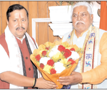
के साथ पूरी मजबूती के साथ हम जुड़ते भी हैं। सदन में हमें सीखने को मिलता है कि कैसे जनता की बातों को सरकार के समक्ष रखे और जनता की आवाज बनकर बैठे। नितिन नवीन ने कहा कि एक-एक विधायक के तौर पर तमाम विषयों को लेकर हम सदन में बैठते हैं और यहां से लेकर सदन की भी गरीमा कैसे बढ़े, इसकी भी चिंता करते हैं। 2006 में पहली बार विधायक बना और तब से सदन में देखता आ रहा हूँ कि किस तरह से मुख्यमंत्री नीतीश कुमार ने बिहार की छवि को सुधारने का काम किया। हमलोग भी जब दूसरी जगह

नवबिहार टाइम्स ब्यूरो पटना। बिहार विधानसभा की कार्यवाही के बीच बांकीपुर से भाजपा विधायक और भारतीय जनता पार्टी के राष्ट्रीय अध्यक्ष नितिन नवीन मंगलवार को सदन में पहुंचे। इसके बाद सदन में मौजूद सदस्यों ने उनका पूरे गर्मजोशी से स्वागत किया। भाजपा का राष्ट्रीय अध्यक्ष बनने के बाद नितिन नवीन पहली बार सदन पहुंचे। इस मौके पर सदन की तरफ से स्पीकर ने उनका स्वागत किया। सदन में बोलते हुए नितिन नवीन ने कहा कि मेरा विधायकी जीवन पूरे बीस साल का रहा है। आज के दिन की कल्पना मैंने कभी नहीं की थी। आज जिस प्रकार से सदन में मौजूद सभी अभिभावकों के शब्दों से जो आशीर्वाद मुझे मिला है, उसके लिए पूरे सदन का आभार व्यक्त करता हूँ। उन्होंने कहा कि जब से हम इस सदन में आए तबसे मुख्यमंत्री नीतीश कुमार को काम करते देखा है। जो नए लोग आते हैं राजनीति में, वह जहां एक ओर अपनी पार्टी के विचारों के साथ आते हैं और दूसरी तरफ जनता के बीच से एक मत लेकर आते हैं। सदन में जनता के मुहों