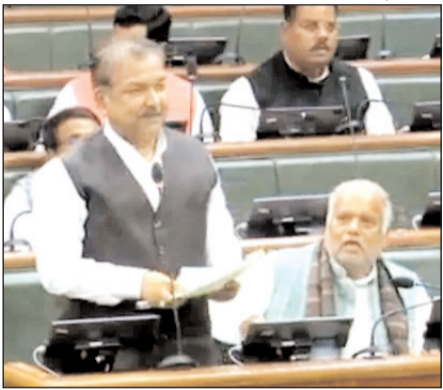
से सभी सिंगल लेन पथों (5000 किमी) को दो लेन या फिर उससे अधिक चौड़ा करने की योजना पर मुख्यमंत्री पथ विस्तारिकरण योजना के तहत काम कर रही है। पथ निर्माण मंत्री ने बिहार के लिए घोषित पांच

पटना। पथ निर्माण मंत्री डॉ. दिलीप जायसवाल ने मंगलवार को विधानसभा में वित्तीय वर्ष 2026-27 के लिए पथ निर्माण विभाग का बजट पेश किया। इस क्रम में उन्होंने पथ निर्माण विभाग के लिए 82 अरब, 60 करोड़, 16 लाख के सकल बजट की अनुमति मांगी। उन्होंने सदन को यह जानकारी दी कि नेपाल के पशुपतिनाथ मंदिर से झारखंड के बैद्यनाथधाम के बीच हाईस्पीड ग्रीनफील्ड कारिडोर के निर्माण का प्रस्ताव केंद्र सरकार की स्वीकृति के लिए भेजा गया है। इसी तरह नारायणी-गंगा हाईस्पीड ग्रीनफील्ड कारिडोर के निर्माण की स्वीकृति का प्रस्ताव केंद्र सरकार को भेज दिया गया है। पशुपतिनाथ-बैद्यनाथ हाईस्पीड कारिडोर का एलायनमेंट नेपाल के समीप भीमनगर से शुरू होकर बिहार के चानन तक जाएगा। इसकी लंबाई 250 किमी है। सरकार अपने सीमित संसाधन में चरणबद्ध तरीके