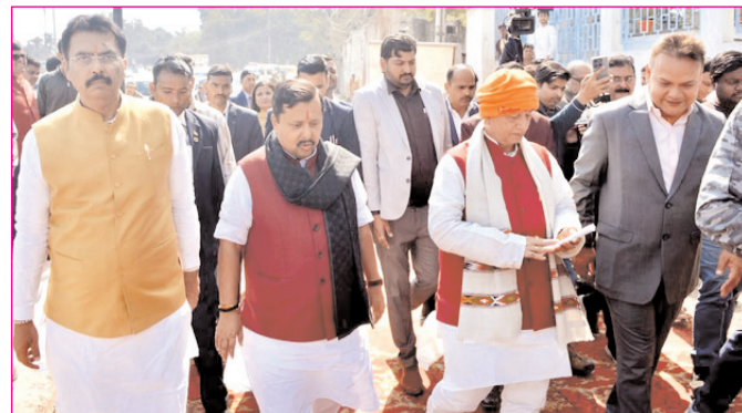
पटना में विकास कार्यों का निरीक्षण करते भाजपा के राष्ट्रीय अध्यक्ष नितिन नवीन

* रजि. नंबर : 52290/90 * वर्ष : 36 * अंक : 255 * पृष्ठ : 12 * औरंगाबाद, बुधवार, 11 फरवरी 2026 * मूल्य : 3.00 रुपये * औरंगाबाद, पटना एवं बोकारो से प्रकाशित * www.navbihartime.com