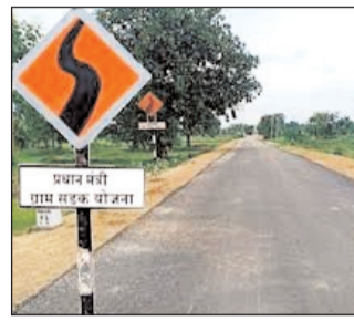
अंश के रूप में 165.53 करोड़ रुपये निर्धारित किए गए हैं, जिसे राज्य सरकार को वहन करना होगा।

पटना। भारत सरकार ने प्रधानमंत्री ग्राम सड़क योजना के अंतर्गत बिहार राज्य को वित्तीय वर्ष 2025-26 के लिए 210 करोड़ रुपये की केंद्रीय सहायता राशि जारी करने की स्वीकृति प्रदान की है। यह राशि अनुदान सहायता के रूप में दी गई है और प्रधानमंत्री ग्राम सड़क योजना के तहत केंद्र सरकार की ओर से उपलब्ध कराई गई है। जारी की गई यह राशि वर्ष 2023-24 के अंतर्गत स्वीकृत कार्यों से संबंधित है, जिनका क्रियान्वयन राज्य में किया जा रहा है। प्रधानमंत्री ग्राम सड़क योजना के इस चरण के लिए कुल केंद्रीय हिस्सेदारी 987.875 करोड़ रुपये निर्धारित की गई है। इसमें से पहले ही 383.75 करोड़ रुपये की राशि बिहार को जारी की जा चुकी है। अब 210 करोड़ रुपये की नई किस्त जारी होने के बाद केंद्रीय हिस्से की शेष राशि 394.125 करोड़ रुपये रह जाएगी। इस किस्त के अंतर्गत राज्य