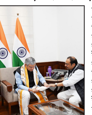
रेल कनेक्टिविटी सशक्त होगी। इससे स्थानीय नागरिकों को प्रत्यक्ष लाभ मिलने के साथ-साथ व्यापार, शिक्षा, स्वास्थ्य एवं पर्यटन के क्षेत्र में भी नई गति आएगी। यह परियोजना

नवबिहार टाइम्स संवाददाता नवादा। भाजपा नेता एवं नवादा सांसद विवेक ठाकुर ने दिल्ली में रेलमंत्री अश्विनी वैष्णव से शिष्टाचार मुलाकात की। इस दौरान नवादा-पावापुरी नई रेल लाइन के निर्माण कार्य को प्रारंभ करने हेतु बजट आवंटन के लिए रेलमंत्री का आभार व्यक्त किया। साथ ही तिलैया-कोडरमा नई रेल लाइन के निर्माण कार्य की प्रगति स्थिति पर भी विस्तार से चर्चा किया। सांसद विवेक ठाकुर ने कहा कि ये दोनों नई रेल परियोजनाएं विकसित नवादा की दिशा में अत्यंत महत्वपूर्ण कदम हैं। इन परियोजनाओं के पूर्ण होने से नवादा सीधे पटना एवं दिल्ली मैन लाइन से जुड़ेगा, जिससे क्षेत्र की