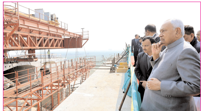
कच्ची दरगाह-बिदुपुर छह लेन गंगा पुल परियोजना के निर्माण कार्य का जायजा लेते सीएम नीतीश कुमार

* मूल्य : 3.00 रुपये * औरंगाबाद एवं बोकारो से प्रकाशित * www.navbihartime.com