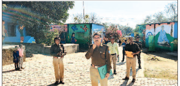
नगरपालिका चुनाव-2026 के मद्देनजर पुलिस अधीक्षक बोकारो ने बेरमो, फुसरो एवं चंद्रपुरा थाना क्षेत्र स्थित बूथों की सुरक्षा व्यवस्था एवं मूलभूत सुविधा का किया निरीक्षण।

संबंधित समस्त जानकारी एवं अर्हताधारियों की विस्तृत सूची कार्यालय सूचना पट पर प्रदर्शित कर दी गई है। अनुरूप आगे की सभी प्रक्रियाएं संपन्न कराई जाएंगी।