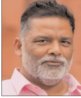
नवबिहार टाइम्स संवाददाता पटना। 31 साल पुराने एक मामले में गिरफ्तार सांसद पप्पू यादव को कोर्ट के आदेश पर ज्यूडिशियल कस्टडी में बेर जेल भेज दिया गया है। गिरफ्तारी के बाद उन्हे पटना सिविल कोर्ट में पेश किया गया, जहां सुनवाई के बाद न्यायालय ने उन्हे न्यायिक हिरासत में भेजने का आदेश दिया। हालांकि, उनकी स्वास्थ्य स्थिति को देखते हुए जेल भेजने से पहले इलाज की व्यवस्था की गई है। प्रशासन के अनुसार, सांसद पप्पू यादव का इलाज पटना मेडिकल कॉलेज अस्पताल में कराया जाएगा। पूरे घटनाक्रम के दौरान सुरक्षा के कड़े इंतजाम किए गए थे। जानकारी के अनुसार, यह मामला करीब 31 साल पुराना है, जिसमें सांसद पप्पू यादव के खिलाफ न्यायालय में सुनवाई लंबित थी। इसी सिलसिले में पुलिस ने पटना से उन्हें गिरफ्तार किया। गिरफ्तारी के बाद उन्हे सीधे सिविल कोर्ट लाया गया। कोर्ट परिसर में किसी अप्रिय स्थिति से निपटने के लिए अतिरिक्त पुलिस बल की तैनाती की गई थी। सुनवाई के