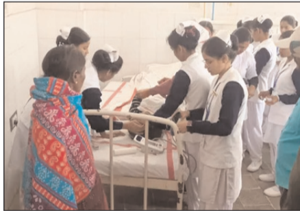
नवबिहार टाइम्स संवाददाता

नवादा। अनुमंडल मुख्यालय स्थित इंटर विद्यालय में इंटरमीडिएट के केम्पेस्ट्री परीक्षा के दौरान एक छात्रा अचानक बेहोश हो गई। बाद में कारण का पता चला तो सभी हैरान रह गए। इससे कुछ देर के लिए परीक्षा केंद्र पर अफरा-तफरी की स्थिति बन गई। हालांकि, प्रशासन और चिकित्सा टीम की तत्परता से छात्रा को समय पर इलाज मिला और वह पुनः परीक्षा में शामिल हो सकी। परीक्षा के दौरान वीक्षक ने छात्रा की तबीयत बिगड़ते देख तुरंत इसकी सूचना केंद्राधीक्षक और प्रतिनिधुक्त