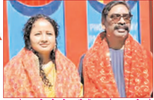
रामगढ़ के रजण्या स्थित छिन्नमस्तिका मंदिर में पूजा-अर्चना कर बाहर निकलते मुख्यमंत्री हेमंत सोरेन एवं उनकी पत्नी एवं विधायक कल्पना सोरेन