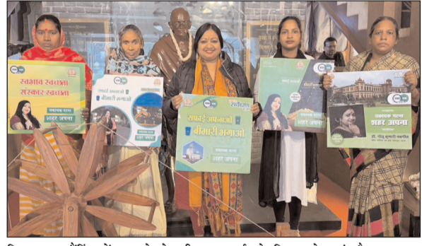
कि स्वच्छता रैंकिंग में पटना के बेहतरीन प्रदर्शन के लिए आगे आए और स्वच्छता