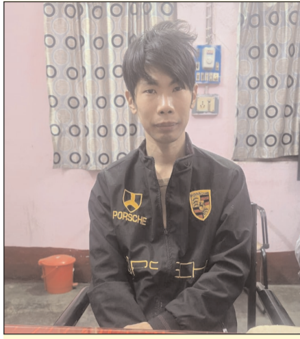
नवबिहार टाइम्स संवाददाता