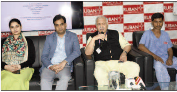
किसी भी प्रकार का चीरा या स्थायी निशान नहीं पड़ता। पारंपरिक थायरॉइड