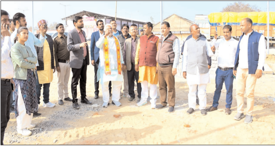
शीघ्र पूरे कराने के निर्देश दिए। बताया कि गया जी की कृषि उत्पादन बाजार समिति परियोजना