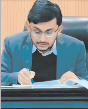
कम 50 प्रतिशत हलकावार और 70 प्रतिशत ओवरऑल निबंधन बुधवार शाम तक हर हाल में पूरा