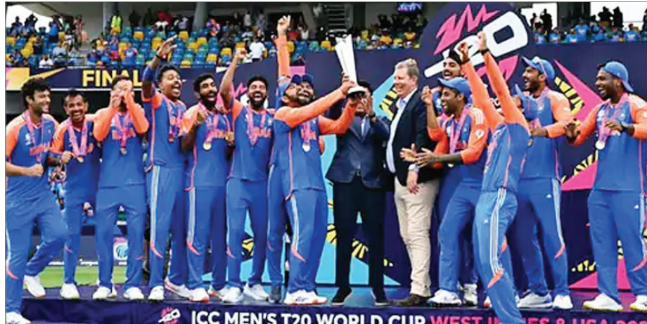
कैप्टन्स डे मीट बीसीसीआई ऑफिस वानखेड़े स्टेडियम (मुंबई) में आयोजित की जाएगी। कोलंबो में 8 देशों के कप्तानों की कैप्टन्स डे

ग्रुप-1 की प्रेस कॉन्फ्रेंस दोपहर 3:00 बजे और ग्रुप-2 की प्रेस कॉन्फ्रेंस 3:30 बजे शुरू होगी। यह