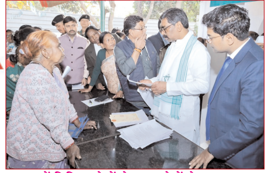
दुमका में विभिन्न क्षेत्रों से आए लोगों से मुलाकात कर उनकी समस्याओं को जानते मुख्यमंत्री हेमंत सोरेन