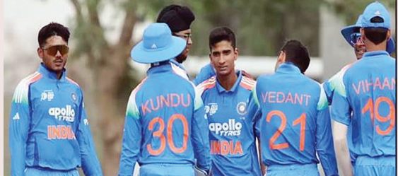
सबसे सफल बल्लेबाज रहे हैं। बाएं हाथ के इस बल्लेबाज ने 5 मैचों में 199 रन बनाए हैं, जिसमें 2 अर्धशतक शामिल हैं। ओपनर वैभव सूर्यवंशी ने भी शानदार फॉर्म दिखाई है। उन्होंने 5

● अभिज्ञान, सूर्यवंशी भारत के सबसे भरोसेमंद बल्लेबाज- विकेटकीपर-बल्लेबाज अभिज्ञान कुंडू भारत के लिए अब तक