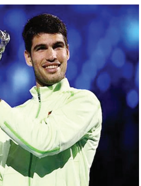
एग्जिबिशन बिल्लिंग्स में आयोजित एक सेलिब्रेशन फोटोशूट में भी हिस्सा लिया, जहां ऑस्ट्रेलियन ओपन जीत का जश्न मनाया गया।

ऑस्ट्रेलियन ओपन जीत के बाद लिया फैसला- 22 वर्षीय अल्काराज ने यह फैसला उस ऐतिहासिक उपलब्धि के ठीक एक दिन बाद लिया, जब उन्होंने करियर ग्रैंड स्लैम पूरा करने वाले सबसे कम उम्र के खिलाड़ी बनने का रिकॉर्ड बनाया। रविवार को खेले गए ऑस्ट्रेलियन ओपन फाइनल में उन्होंने नोवाक जोकोविच को चार सेट में हराकर मेलबर्न में अपना पहला ऑस्ट्रेलियन ओपन खिताब जीता था।