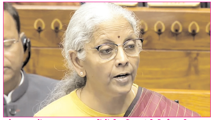
लोकसभा में बजट भाषण पढ़ती केंद्रीय वित्त मंत्री निर्मला सीतारमण

वित्त मंत्री निर्मला सीतारमण ने लगातार नौवीं बार पेश किया देश का बजट