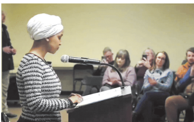
की गोली मारकर हत्या कर दी थी। भाषण दे रही थीं, तभी उनपर ये हमला इल्हान उमर इस घटना के खिलाफ हो गया। हमले से ठीक पहले उमर

वाशिंगटन, एजेंसी। अमेरिका में विपक्षी डेमोक्रेटिक पार्टी की सांसद इल्हान उमर पर किसी अज्ञात व्यक्ति ने अचानक हमला कर दिया। उमर मिनियापोलिस के एक टाउन हॉल में लोगों को संबोधित कर रही थीं, तभी हमलावर उनके करीब पहुंचा और उमर पर अज्ञात पदार्थ फेंक दिया। मीके पर मौजूद पुलिस ने हमलावर को हिरासत में लेकर मामला दर्ज कर लिया है। पुलिस इस पूरे मामले की जांच कर रही है। गृह मंत्री से की इस्तीफे की मांग - दरअसल इसी महीने ट्रंप के आब्रजन और सीमा शुल्क प्रवर्तन एजेंट ने मिनियापोलिस में एक महिला