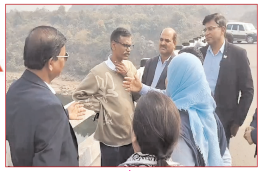
धनबाद की जमुनिया नदी का औचक निरीक्षण करती केंद्र सरकार के पर्यावरण, वन और जलवायु परिवर्तन मंत्रालय की टीम