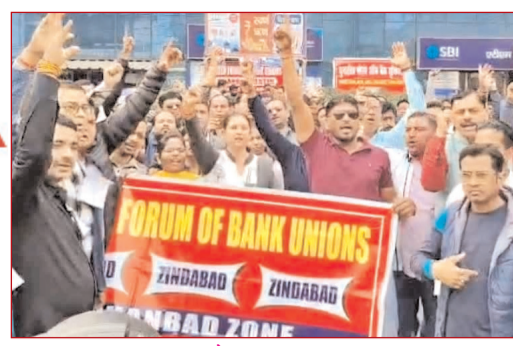
यूनाइटेड फोरम ऑफ बैंक यूनियंस के आह्वान पर मांगों को लेकर प्रदर्शन करते विभिन्न बैंकों में कार्यरत कर्मचारी