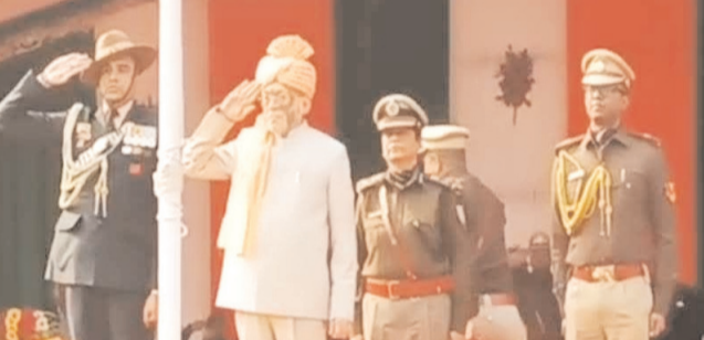
योजना की चर्चा करते हुए राज्यपाल ने सम्मान, स्वाभिमान, स्वावलंबन और सुरक्षा के लिए सरकार प्रभावी कदम उठा

नवबिहार टाइम्स ब्यूरो रांची। गणतंत्र दिवस के मौके पर ऐतिहासिक मोरहाबादी मैदान में आयोजित राज्यस्तरीय समारोह में राज्यपाल संतोष कुमार गंगवार ने राष्ट्रीय ध्वज फहराया। समारोह के दौरान अलग-अलग झांकियां प्रदर्शित की गईं। इसमें झारखंड की संस्कृति, राज्य सरकार की कल्याणकारी योजनाओं, स्वास्थ्य और शिक्षा की झलकियां दिखाई गईं। परेड निरीक्षण के बाद राज्यपाल संतोष कुमार गंगवार ने राज्यवासियों को संबोधित करते हुए भारत सरकार द्वारा दिशोम गुरु शिवु सोरेन को पद्म विभूषण से सम्मानित किए जाने पर खुशी जाहिर की और केंद्र सरकार के प्रति आभार जताया। इस मौके पर राज्यपाल ने राज्य सरकार द्वारा चलाई जा रही योजना और विकसित भारत के संकल्प को पूरा करने के लिए किए जा रहे कार्यों की चर्चा की। उन्होंने कहा कि राज्य में पेसा नियमावली लागू कर दिया गया है, जो जनजातियों के विकास में मील का पत्थर साबित होगा। झारखंड मुख्यमंत्री मंडीया सम्मान, स्वाभिमान, स्वावलंबन और सुरक्षा के लिए सरकार प्रभावी कदम उठा